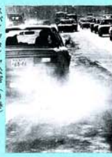
スハイタイヤ公害(9巻)