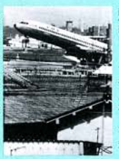
大阪国際空港の公害(8巻)