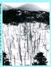
酸性雨による立ち枯れの木々(12巻)