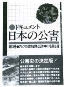
表示価格は消費税が軽減されます。