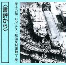
厚子力船のコンクリート航海施設建設工事

グラビア七頁 本文三五四頁 3,200円 日本の開発援助や企業進出によるアジアの国々にて引き起こされる公害や環境破壊、焦点をあてる。内容 環境配慮のない「空洞ODA」／進出企業と公害輸出／アジアの公害・自然破壊／対応を迫られている課題／総索引